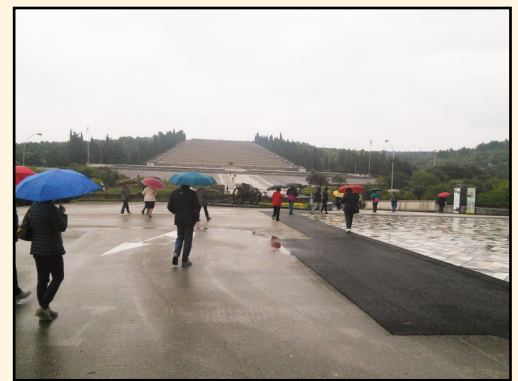
IL Sacrario di Redipuglia