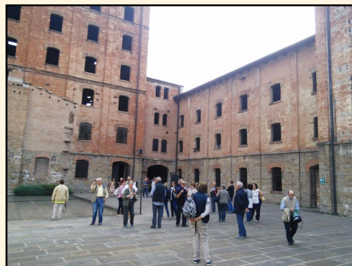
La Risiera di San Sabba